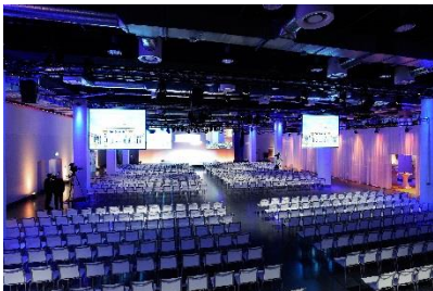
Konferenzfeeling mit Theaterbestuhlung, © Vienna House