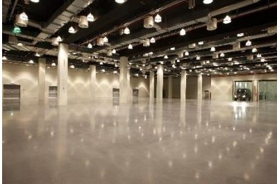
Zwei LKW-Aufzüge für tonnenschwere Logistik