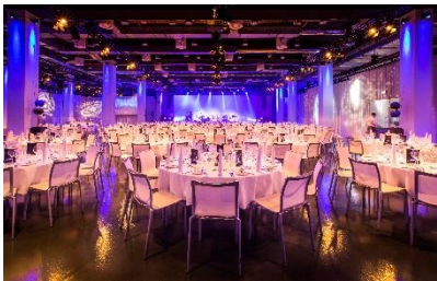
Gala Dinner mit Bankettbestuhlung