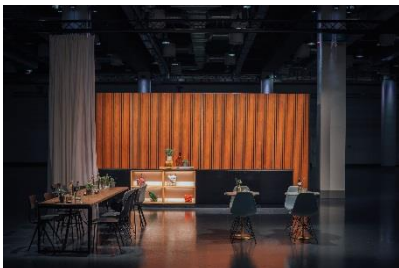
Studioatmosphäre im Küchenstil, © Vienna House