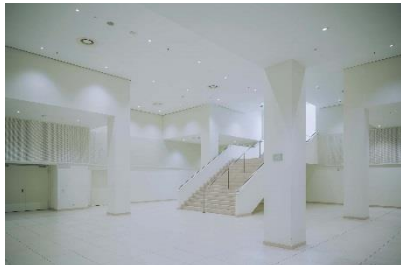
Großzügiges Entree mit Foyers und separatem Eingang, © Vienna House